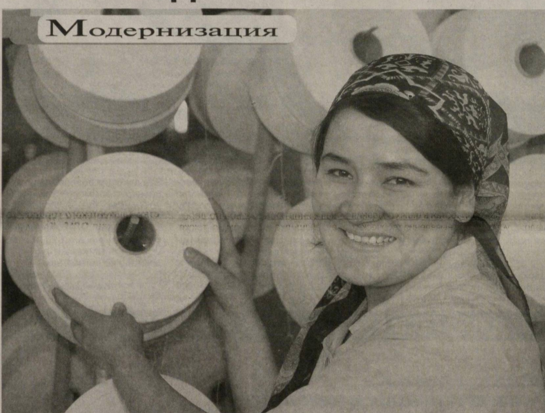
В рамках принятой программы технической модернизации на ООО «Маргилон Осие Текс», что в Ферганской области, осуществлено техническое и технологическое обновление производства.

Выделенные на эти цели средства были использованы на покупку и монтаж современного оборудования китайского произ-