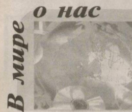
В мире О нас (Окончание. Начало на 1-й стр.)