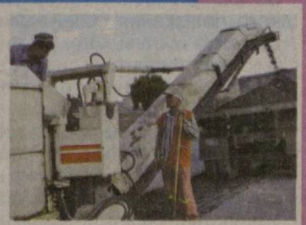
(Из доклада Президента Республики Узбекистан Ислама Каримова на заседании Кабинета Министров, посвященном итогам социально-экономического развития страны в 2009 году и важнейшим приоритетам экономической программы на 2010 год).

За прошедший год введены в эксплуатацию 217 км, осуществлен капитальный ремонт 538 км автомобильных дорог и 19 мостов. На выполнение этих работ направлено свыше 280 миллиардов сумов за счет Дорожного фонда республики.