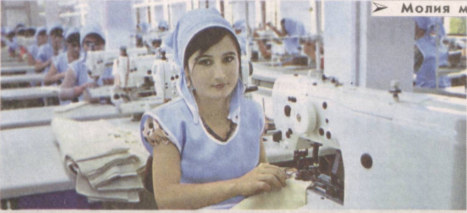
➤ Молия муассасаларида