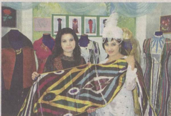
лоийҳалари шулар жумласидандир.

Ўтказилган лойиҳадан кўзланган асосий мақсад ҳам ҳудудлардаги касб-хунар коллежлари битирувчилари бандлигини таъминлаш, ёшларнинг инновацион лойиҳа ва ташаббусларини иқтисодиётга жорий этишга қаратилган.