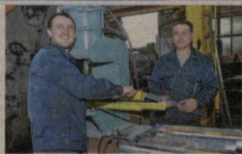
(Из доклада Президента Республики Узбекистан Ислама Каримова на заседании Кабинета Министров, посвященном итогам социально-экономического развития страны в 2009 году и важнейшим приоритетам экономической программы на 2010 год.)

В результате осуществления последовательной программы доля промышленного производства в ВВП страны в 2009 году против 2000 года возросла с 14 до 24 процентов, транспорта и связи — с 7,7 до 12 процентов.