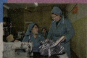
(Из доклада Президента Республики Узбекистан Ислама Каримова на заседании Кабинета Министров, посвященном итогам социально-экономического развития страны в 2009 году и важнейшим приоритетам экономической программы на 2010 год.)

Важнейшим направлением занятости населения является стимулирование надомного труда в кооперации с промышленными предприятиями и выполнении работ на дому по договору подряда, за счет чего было создано около 130 тысяч рабочих мест.