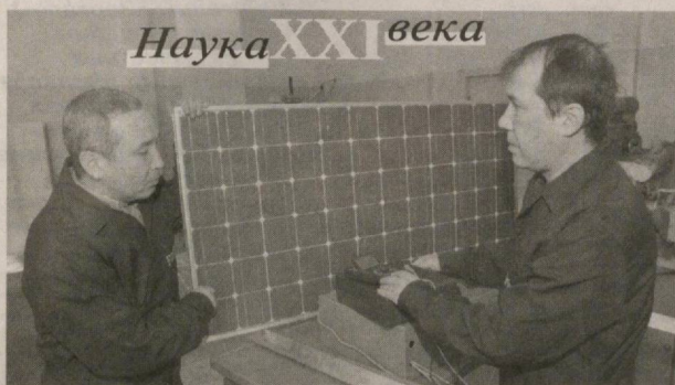
Наука XXI века

Глава нашего государства в книге «Мировой финансово-экономический кризис, пути и меры по его преодолению в условиях Узбекистана» определяет модернизацию электроэнергетики с целью сокращения энергоёмкости и внедрение эффективной системы энергосбережения в качестве одной из антикризисных мер.