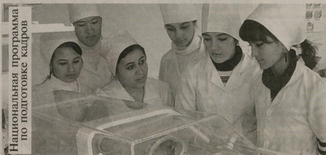
Национальная программа по подготовке кадров

Благодаря открытию в Зарафшане медицинского колледжа, все лечебные учреждения города золотодобывчиков, а также Учкудукского и Тамдынского районов теперь регулярно пополняются молодыми квалифицированными специалистами среднего звена.