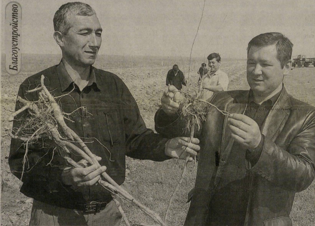
В Джизакской области завершилась работа по благоустройству и озеленению территории вдоль дорог Джизак — Даштабад и Заамин — Даштабад.

По обе стороны дорог, протяженностью более 20 километров каждая, посажено 78 тысяч саженцев фруктовых и декоративных деревьев.