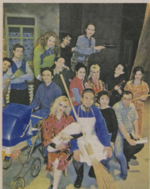
На театральных подмостках

Что будет, если в обычном городском дворе, жители которого похожи на большую шумную семью, начнут снимать кино, а многочисленные соседи станут актерами? Ответить на этот вопрос попытались в Ташкентском государственном театре музыкальной комедии (оперетты). Новая постановка храма искусства, премьера которой состоялась на днях, называется «Снимается кино» или «А у нас во дворе-2». Это продолжение любимейшего зрителям спектакля-концерта о милом дворике, где живут яркие, смешные, да к тому же отлично поющие персонажи.