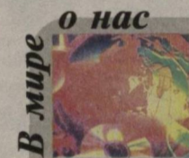
В мире О нас

Во Франции в здании верхней палаты французского парламента Постоянным представительством Республики Узбекистан при ЮНЕСКО, Посольстве Узбекистана совместно с Сенатом Франции состоялось торжественное открытие фотовыставки «Узбекистан глазами француз», организованной в рамках мероприятий, посвященных празднованию Навруза.