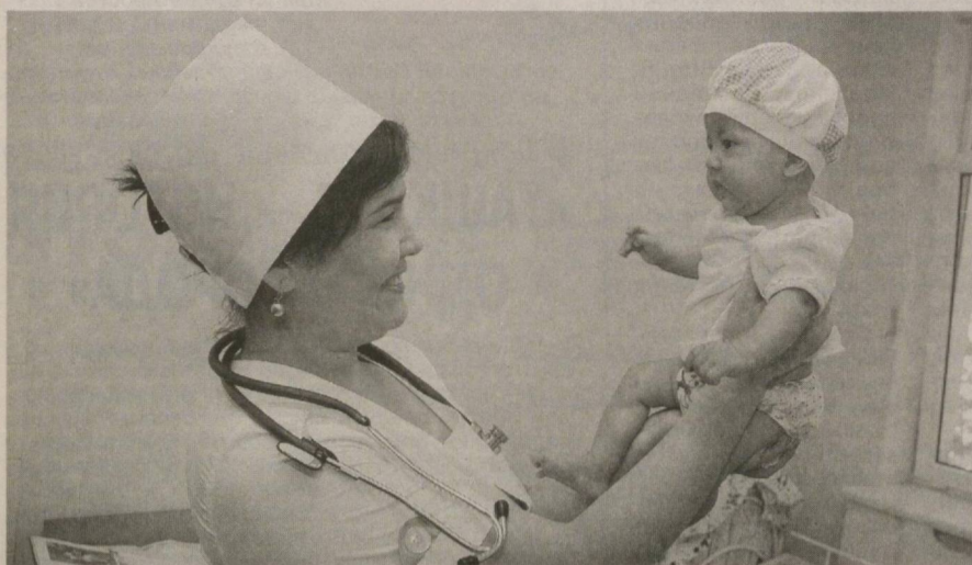
Объявляя нынешний год Годом гармонично развитого поколения, Президент отметил, что здоровое поколение прежде всего означает здоровое потомство. В этом направлении за прошедшие годы на основе программы «Здоровая мать — здоровый ребенок» были реализованы масштабные мероприятия.

Вместе с тем возникают все новые и новые вопросы по профилактике ряда жизненно опасных заболеваний, укреплению материально-технической базы медицинских учреждений, стимулированию труда медработников. В этой связи, учитывая большой объем задач, которые предстоит решить, из государственного бюджета 2010 года предусматривается выделение на финансирование здравоохранения порядка 1 триллиона 700 миллиардов сумов, то есть увеличение направляемых в эту сферу средств по сравнению с 2009 годом на 30 процентов.