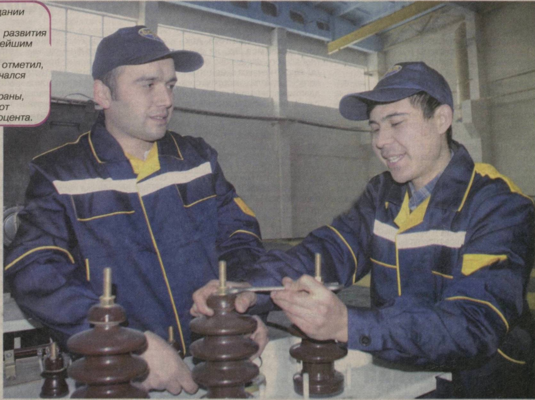
Год малого бизнеса и частного предпринимательства

В частности, мощный импульс развития был придан такой отрасли, как электротехническая промышленность. На сегодняшний день на предприятиях этой сферы выпускается широкий ассортимент продукции, имеющей самый широкий спектр применения — высоковольтное и низковольтное оборудование, кабели, бытовая техника и прочие товары народного потребления. Принимаются меры по расширению производства, освоению новых