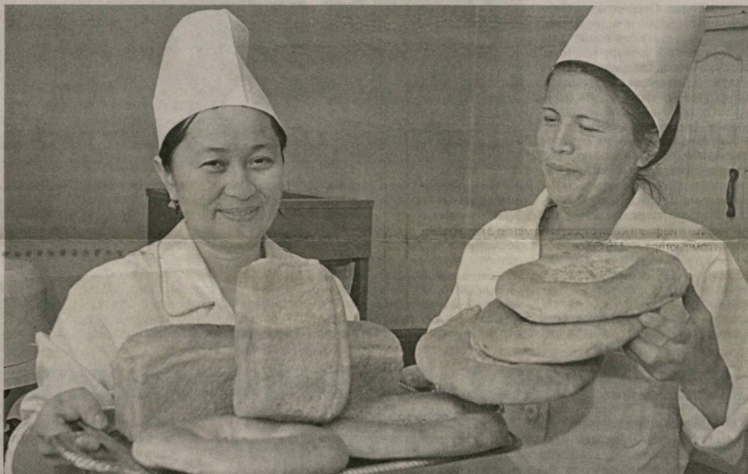
БЛАГОДАРЯ оказываемой поддержке со стороны государства отечественные фермеры не только выращивают высококачественную сельхозпродукцию, но и успешно перерабатывают ее.