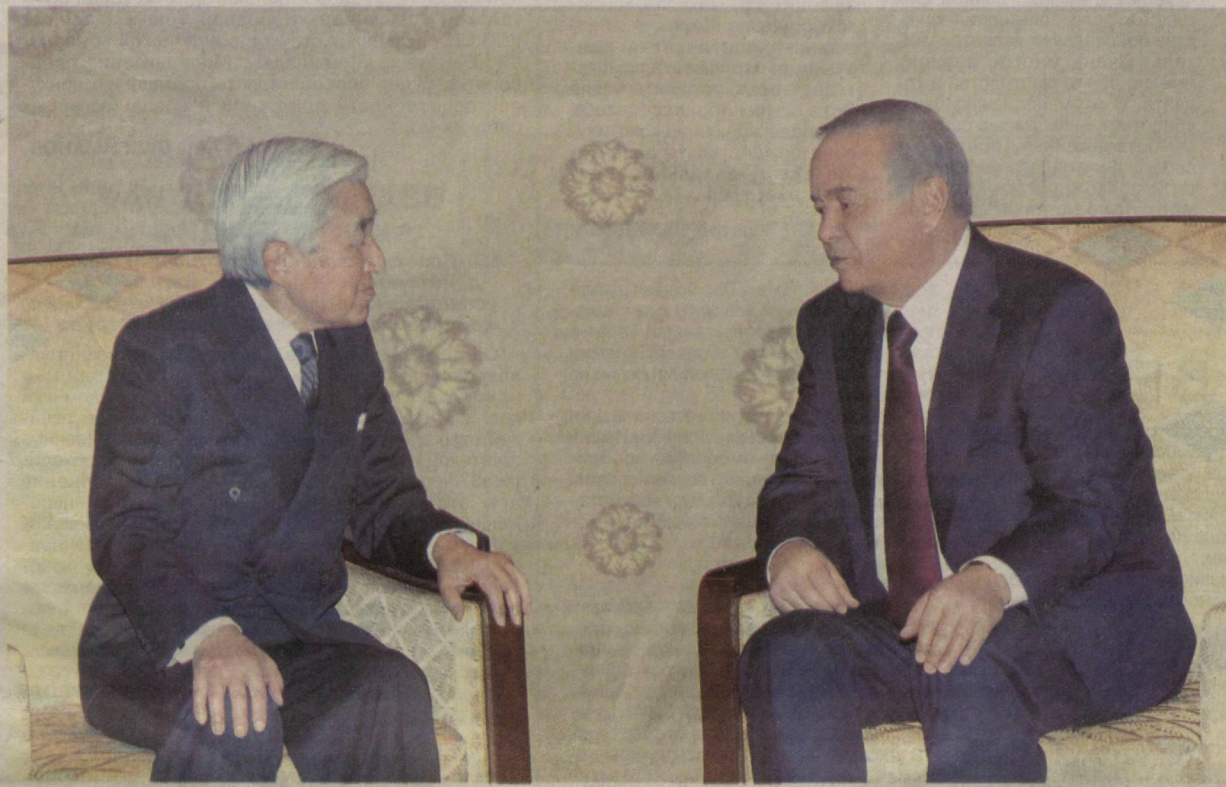
ТОКИО, 9 февраля. Передаст специальный корреспондент УзА Олим ТУРАКУЛОВ.

Как сообщалось ранее, Президент Республики Узбекистан Ислам Каримов по приглашению Премьер-министра Японии Наото Кана 8 февраля прибыл с официальным визитом в Токио. 9 февраля состоялись встречи руководителя Узбекистана с Императором Японии Акихито, Премьер-министром страны Наото Каном, министром иностранных дел Сейдзи Маехарой.