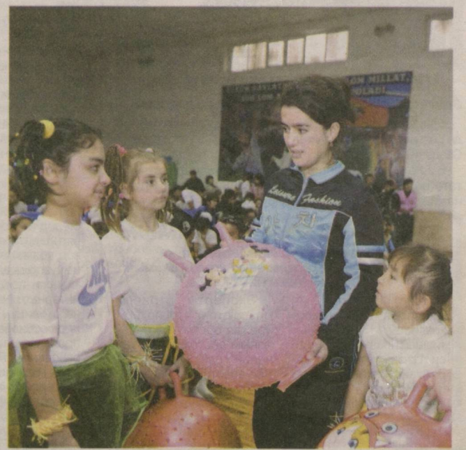
Гимнастрада В СПОРТИВНОМ комплексе «Олимпийские надежды» Сергелийского района столицы состоялись соревнования по гимнастике.

Цель соревнований, организованных Сергелийским районным хокимиятом, Фондом развития детского спорта, районными отделениями по делам культуры и спорта и народного образования, фондом «Соглом авлод учун», — широкое привлечение молодого поколения к спорту и формирование навыков здорового образа жизни. В соревнованиях в составе девяти команд приняли участие школьники в возрасте 10—16 лет, сообщает УзА. Первое место заняла команда Сергелийского промышленного профессионального колледжа, второе — учащиеся Куйлюкского профессионального колледжа бытовых услуг, третье — представительницы школы № 264.