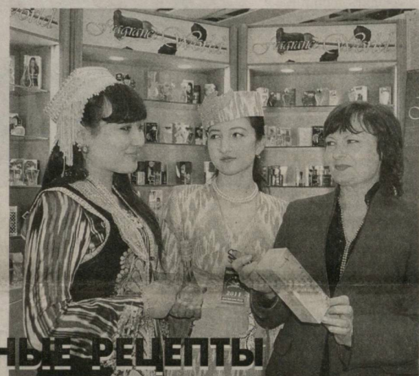
Светлана АРТЫКОВА, председатель Комитета Сената Олий Мажлиса Республики Узбекистан.

С оптимизмом смотрят в будущее и на частном производственном предприятии «Mirsazava» из Яксарайского района. Здесь выпускают широкий спектр электротехники, в том числе звукоусилительное и световое оборудование. И эта продукция также находит спрос на многочисленных объектах