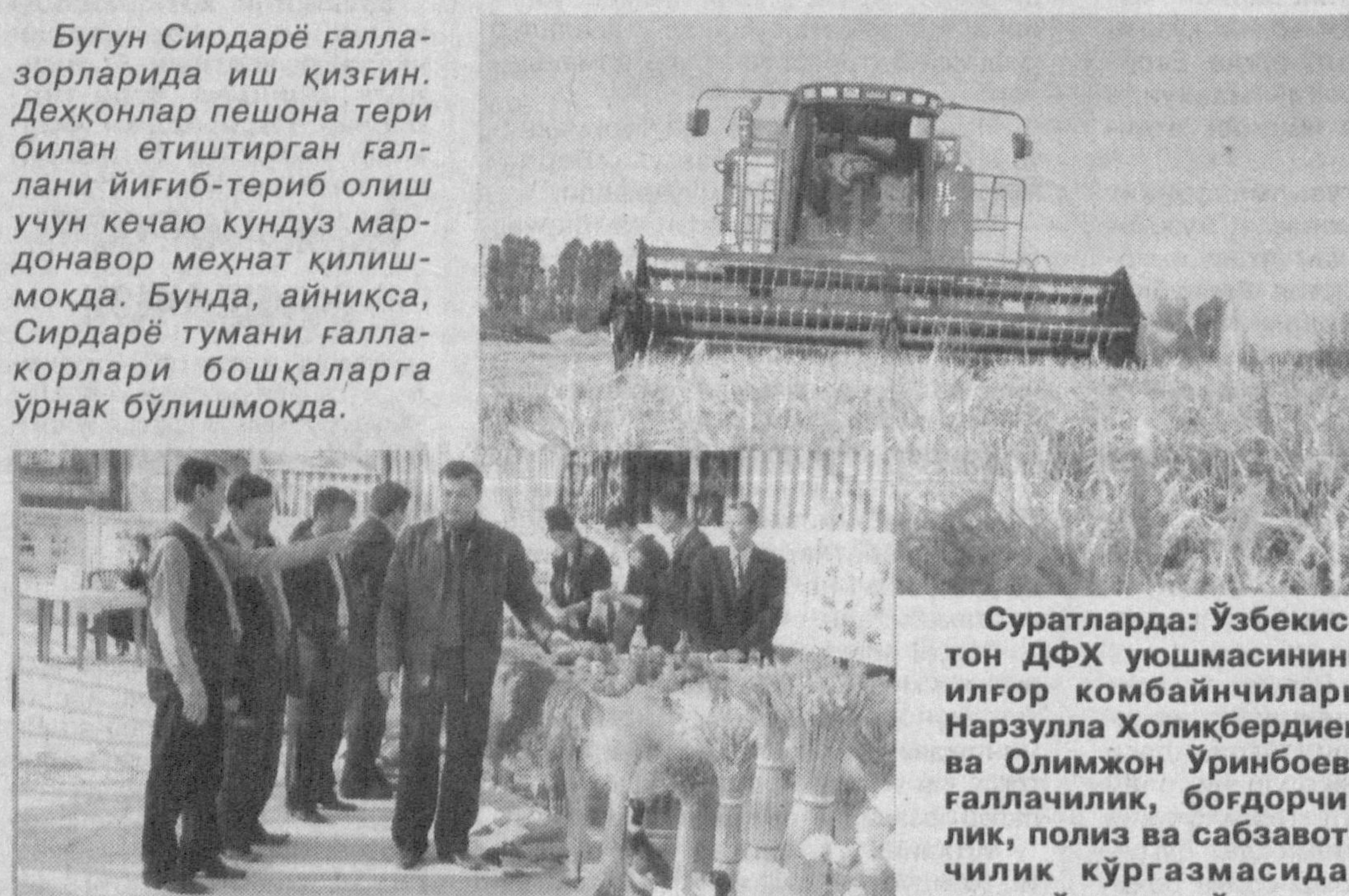
Бугун Сирдарё галлазорларида иш қизғин. Деҳқонлар пешона тери билан етиштирган галлани йигиб-териб олиш учун кечаю кундуз мардондор меҳнат қилишмоқда. Бунда, айниқса, Сирдарё тумани галлазорлари бошқаларга ўрнак бўлишмоқда.