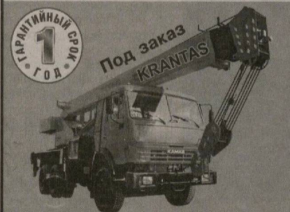
ВОЗМОЖЕН МОНТАЖ НА ШАССИ ЗАКАЗЧИКА