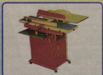
Универсальный деревообрабатывающий станок 3Н340: