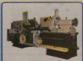
Универсальный токарно-винторезный станок 1М63Н: