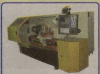
Модернизированный токарный станок 16А20Ф3: