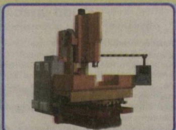
Универсальный фрезерно-расточной станок НФ630М: