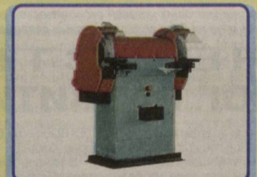
Обдирочно-шлифовальный станок 3Н340: