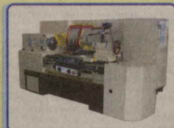
Универсальный токарный станок НТ250М: