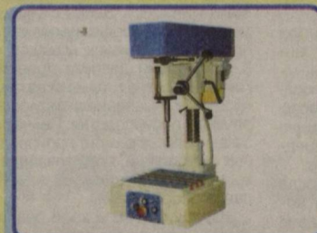
Специальный настольно-сверлильный станок 2Н16: