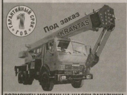
ВОЗМОЖЕН МОНТАЖ НА ШАССИ ЗАКАЗЧИКА