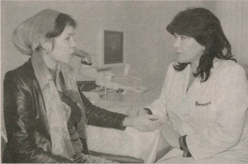
Медицина на селе

В СКРИНИНГ-ЦЕНТРЕ Сурхандарьинской области проводится работа, направленная на охрану материнства и детства, формирование здорового поколения, дальнейшее совершенствование качества медицинского обслуживания. Здесь трудятся около двадцати квалифицированных сотрудников.