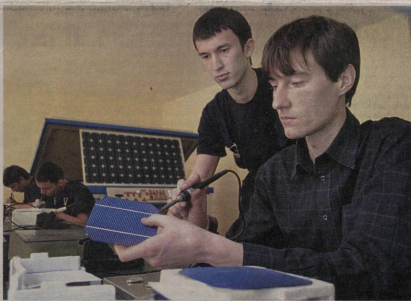
Год малого бизнеса и частного предпринимательства