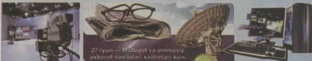
27-iyun — Матбуот ва оммавий ахборот воситалари ходимлари кун

Юртимиз равнақи, эл фаровонлиги, Ватанимиз ободлиги йўлидаги фидокорона ишларингизда доимо омад ёр бўлсин!