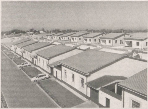
Давоми. Бошиқ 1-бегда

Бундай қонуности ҳужжати-нинг қабул қилиниши ҳаётини зарурат эди. Чунки қишлоқларда уй-жой қурилиши, ободончилик ишларини амалга ошириш борасида кўпдан-кўп муаммолар йиғилиб қолган, улар ўз оқилона ечимини кутаётган эди. Уй-жойлар бош режаларсиз қурилар, худудларнинг ўзига хос табиий ва иқлимий хусусиятлари, оилаларнинг миллий анъаналари ҳисобга олинб ишлаб чиқилган намунавий лойиҳалар йўқ эди. Ўзига ўзи уй солаётган кишининг имкониятлари чекланган, қурилиш материалларининг доимий танқислиги мавжуд, қишлоқда ривожланган қурилиш саноти йўқ, бу борадаги ишлар ўз ҳолига ташлаб қўйилган эди. Шунинг учун уйлар қўлоба қурилиш материаллари, яъни хом гишдан тикланар, ёғочдан пол қилинмас, том эса факат асбет шифер билан ёпилар эди. Режасиз қурилган учин ҳам бундай аҳоли пунктларида инфратузилмани шакллантириш, яъни коммунал қўлайликлар билан таъминлашнинг имкони топи-мас, ичимлик суви, электр энергияси ва газ тармоқларини етказиб беришда жиддий муаммолар юзага келар эди. Бундай маҳалларда тиббий муассасалари, савдо шохобчалари, бозорлар барпо этиш қанчалик мушкул бўлгани ҳеч кимга сир эмас. Қарор асосида қишлоқда уй-жой қурилиш комплекс амалга ошириш дастури ишлаб чиқилиб, ўзига хос модель яратилди. Давлат бош ислотчи сифатида уй-жой муҳтож оилалар учун қўлайликлар тизимини яратди. Аввало, яқна тартибда уй-жой қурилишига кредит ажратиш механизми ишлаб чиқилди.