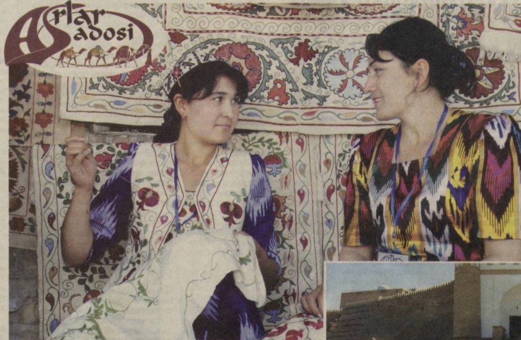
ОГРОМНАЯ работа, проводимая в годы независимости под руководством Президента Ислама Каримова на пути к процветанию и благополучию страны, органично сочетается с возрождением и повышением национальной духовности, сохранением и последовательным развитием вечных ценностей.