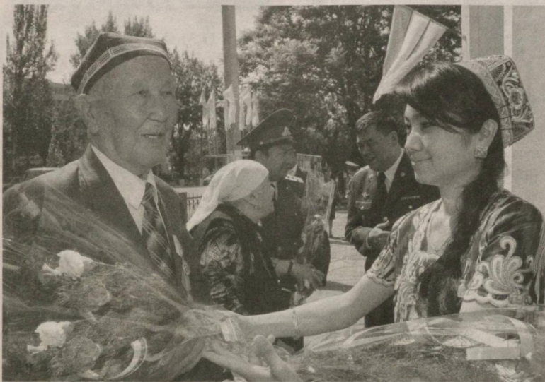
В ЦЕНТРАЛЬНОМ доме офицеров Вооруженных Сил Республики Узбекистан накануне Дня памяти и почестей состоялось чествование ветеранов Второй мировой войны.

Во время его проведения было сказано много теплых слов в адрес представителей старшего поколения, беззаветно любящих свою Родину и являющихся для нынешних