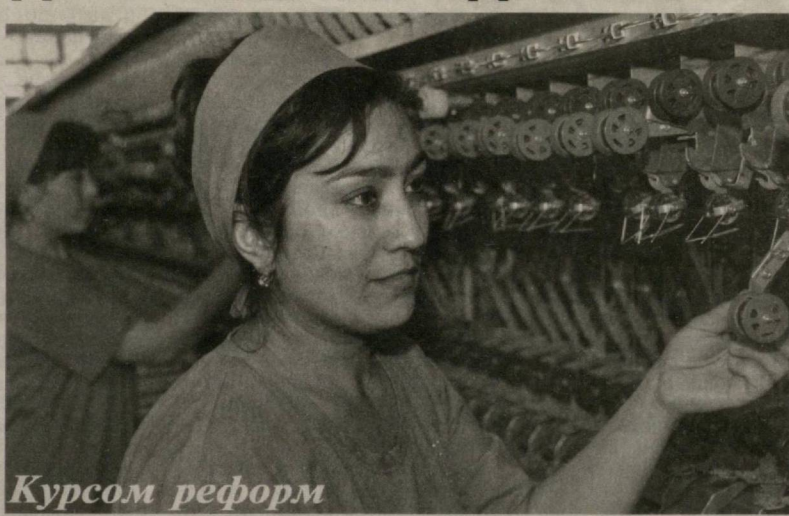
Коллектив предприятия по производству шелковой пряжи, созданного в минувшем году частной фирмой «Жиззах Кохинур», успешно выдержал жесткую конкуренцию на мировом рынке...