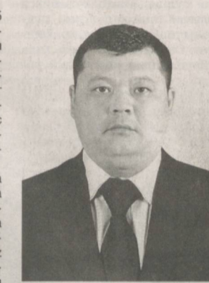
Р.МАТҚУРБАНОВ, Қорақалпоғистон Республикаси Халқ таълими вазири

Ўқитувчилик — шарафли касб. Бугун мамлакатимизда ўқитувчилик касбини эъзозлаш, уларни моддий ва маънавий рағбатлантириш, муносиб меҳнат шaroитини яратиш юзасидан ҳам улкан эътибор ва ғам-хўрлик кўрсатилмоқда. Шу маънода, ҳар бир педагог нафақат юксак билим ва маҳоратга эга бўлмоғи, балки болаларни чин дилдан севиши, ўзидаги билимларни уларга сингдира олиши даркор. Бу эса умумтаълим