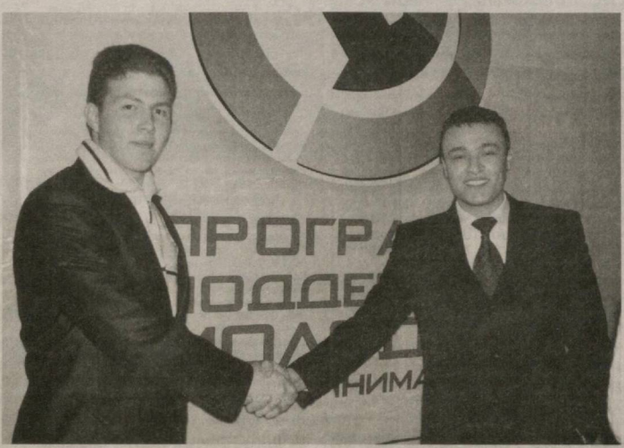
реализовать свои идеи, предпринимательно получить знания в области ведения бизнеса. Этому во многом способствует правильная организация школы. Большим плюсом является также возможность взаимодействия друг с другом, когда опытные бизнесмены могут поде-

выпускников школы лучшим молодым предпринимателям согласно анализу предоставленных финансовых отчетов выделяются специальные гранты Фонда «Форум культуры и искусства Узбекистана». Уже выплачено 30 грантов в размере 30 миллионов сумов. Очередная школа будет организована в Навоийской области в конце мая этого года. Здесь 25 молодых людей получат возможность овладеть навыками становления и развития собственного бизнеса, а 15 бизнес-тренеров смогут усовершенствовать свои способности. Стимулом к развитию работы школы служит объявление в Узбекистане 2011 года Годом малого бизнеса и частного предпринимательства. В заключение нужно отметить, что Школа молодых предпринимателей — это эффективный проект, который дает инициативным людям путевку в жизнь, возможность