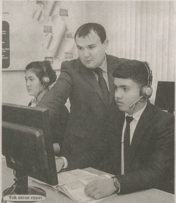
Ушб олган сурат

одоб-ахлоқ, миллий қадриятларга амал қилишда ўқувсизлик қилсалар ёки аксинча миллий қадриятларни, урф-одатларимизни чуқур ўзлаштирсалару, замонавий билимлардан, фан-техника янгиликларидан, танлаган касбларига доир дунёдаги илғор тажрибалардан беҳабар бўлсалар, ҳар икки ҳолатда ҳам маълум муаммолар юзага келади. Шундай экан, таълим-тарбия ҳеч қачон мавсумий ишга айланмаслиги, бу жараён тарбиячилар, устоз-мураббийларнинг ҳамиша диққат марказида бўлмоғи зарур.