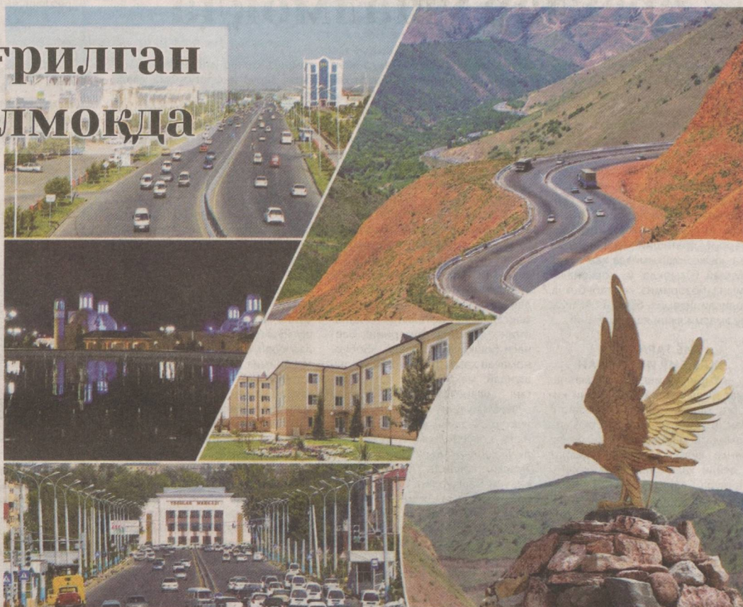
Президент ташрифидан сўнг...