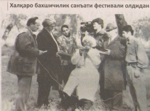
Халқаро бахшичилик санъати фестивали олдидан

Эгамберди бахши (1923 – 2002) Қашқадарё вилоятининг Деҳқонобод туманида туғилган. Болалигида Сурхондарё вилоятининг Шўрчи туманига кўчиб келган. Ёшлигида чўпон, мироҳир (отбоқар) бўлган. Отаси Холли полвон Товошаровдан дўмбира чалиш сирлари ва бадиҳағўйликни ўрганган. Қадимий чолғулардан бўлган шувиллак ва най каби муסיкий асбобларни ўзи ясаган бахши уларни моҳирона ижро этган.