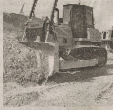
Туркманбоши шаҳрида бўлиб ўтган кенгаш мажлисининг Оролбўйи худуди Экологик инновация ва технологиялар маркази, деб эълон қилинган туман аҳолисига бўлган алоҳида эътибори ва ғамхўрликнинг

Ҳеч бир муболагасиз айтиш мумкинки, давлатимиз раҳбарининг 2017 йил 19 сентябрь куни БМТ Бош Ассамблеясининг 72-сессиясида сўзлаган нутқида жаҳон ҳамжамияти эътиборини яна бир бор Орол фожиясига қаратгани, 2018-2021 йилларда Оролбўйи худудини ривожлантириш бўйича Давлат дастури қабул қилингани, жорий йил август ойида