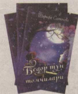
Мен ҳув ўша олислардан маррур тутган бошини, Кексалардек кумуш сочли, хушқад Чотқал қизиман. Сутдек тонда нурга ювган юзларини, сочини, Олис қишлоқ осмонининг митти бир юлдузиман. Шеър ўқиб бўлингач, мухлис-