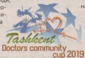
Аъзамжон АБУЛҲАЙЗОВ, «Ishonch» мухбири Икром ҲАСАНОВ олган суратлар

Ҳамюртларимиз гуруҳдаги иккинчи учрашувини бугун – 28 март куни Тожикистон терма жамоасига қарши ўтказди.