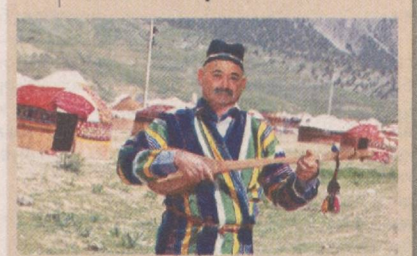
Ўзбекистон халқ бахшиши Бахшикул Тоғоев