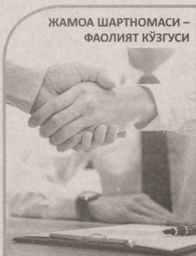
ЖАМОА ШАРТНОМАСИ – ФАОЛИЯТ КЎЗГУСИ