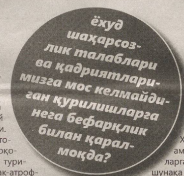
ёқуд шаҳарсозлик талаблари ва қадриятларимизга мос келмайдиган қурилишларга нега бефарқлик билан қаралмоқда?

тўққиз йилдирки, «Сувқова» ДУК раҳбари тилга олган ферма ҳудудида яратилган «сунъий кўлга» оқизилляпти. Ҳар замонада «кўл» тошиб кетмасин деб, оқовасини озайтириб туришади. Бу ҳол теварак-атрофдаги хонадон сохибларини жуда бездириб юборганини айтиб ўтирмайлик. Ахир, кун исгани сари бадебўй ҳид тутиб кетади, нафас олиб бўлмайди.