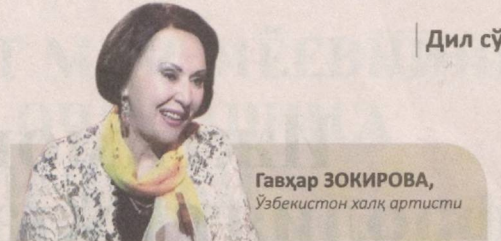
Гавҳар ЗОКИРОВА, Ўзбекистон халқ артисти

Фестиваль фольклоримизга, эл оқинларимизга буюк ҳурмат сифатида тарихда қолади.