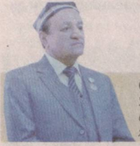
Ортиқ ОТАЖОНОВ, Ўзбекистон, Туркменистон ва Қорақалпоғистон халқ артисти

Достонларда халқ тарихи бор. Биз қандай миллат бўлганмиз – мана шу достонлар айтади. Бахшичиликда миллатимизнинг оғир кечмиши, ундан мардонвор ўтишга куч топа олган, бирлик ва ҳамжиҳатликдаги оталаримизнинг мардлик ва жасурлиги мужассам топган. Бахшиларимизга яхшилаб қулоқ тутинг-а: улар нима ҳақида куйлапти? Улар «Ҳой, болаларим, иниларим, биз жуда улғу авлоднинг ворисларимиз, ота-боболаримиз жуда ориятли бўлган, Ватан учун ўлимга тик бора олган, мард сўзидан қайтмаган, доворликда дунёга номи кетган одамлар бўлган» дея жар солади.