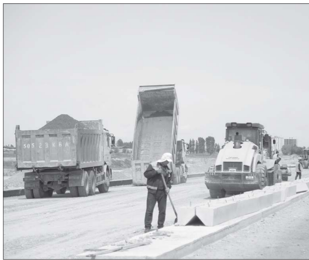
Дар шаҳраки Намангони Нави ноҳияи Давлатободи вилояти Намангон корҳои сохтмон авҷ доранд.

Дар 33 бини истиқомати шаҳрак барои бунёди 2 муассисаи таълими олий платформаи тижорати www.e-avk.uz амал мекунад, ки бинобар натиҷаи савдо то ҳол корҳои бобати сохтмони 24 иншооти истиқоматӣ ва бунёди муассисаҳои таълими олий оғоз ёфтаанд.