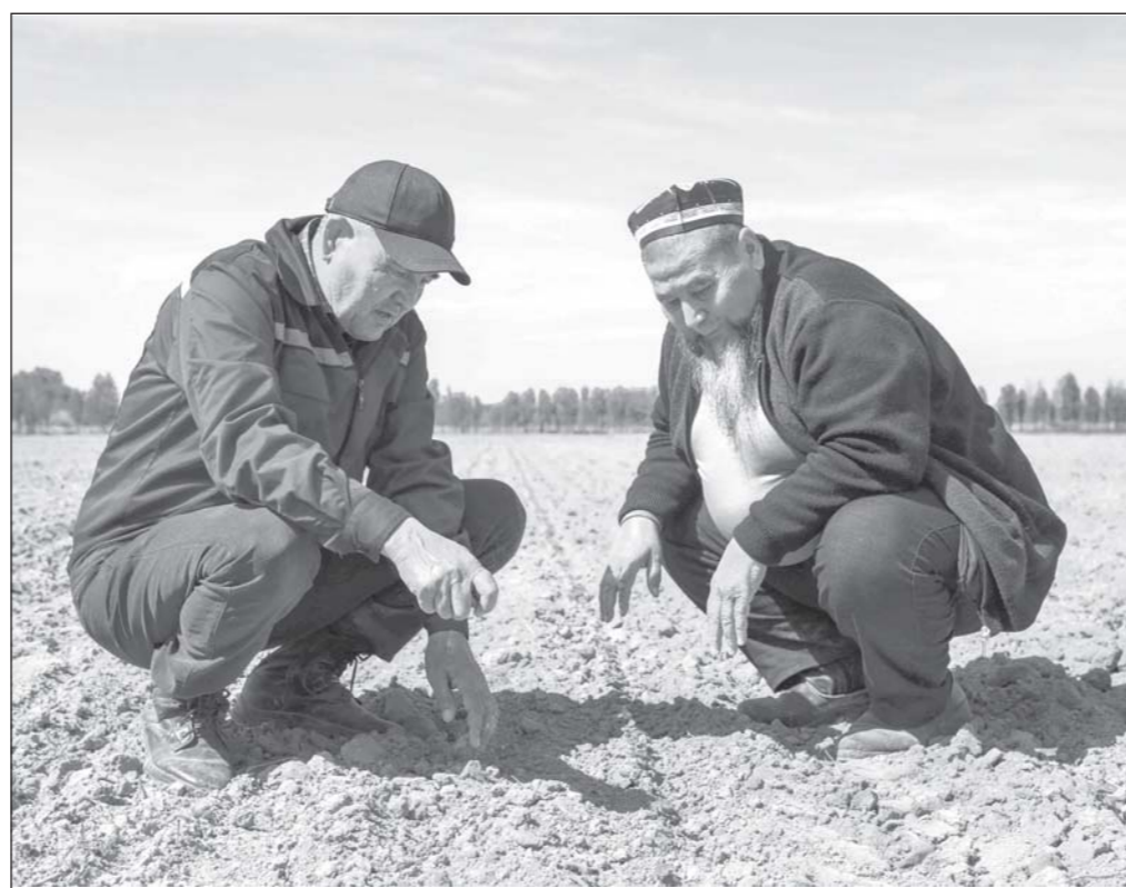
Пешбини шудааст, ки имсол дар ноҳияи Ёзёвони вилояти Фарғона дар 4 ҳазору 900 гектар майдон пунбадона қошта мешавад. Фермерони ёзёвонӣ аз ҳоли ҳозир барои рӯйдани 18500 тонна ашёи хом омодагӣ мегарданд.

Фермерҳо аз 13-уми март қорро оғоз карда буданд. Бино ба маълумотҳои дастрасшуда, то имрӯз дар 98 фоизи майдонҳо пунбадона қошта шудааст. Дар қаторҳои аввали майдони хоҷагӣ ниҳолҳои пахта, аллакай, неш задаанд.