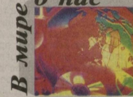
В мире о нас

На сегодняшний день туристы из балтийских стран досконально исследовали Европейский континент, оставшаяся на потом бесчисленные красоты Центральной Азии. Это относится и к жителям Латвии, которые в силу возраста или иных причин не успели совершить путешествие в Ташкент, Хиву, Бухару, Самарканд, Термез, отменилось на презентации. Компания «Dolores Travel Services» представила латвийским туристам программу «По пути караванов-2010», основными направлениями которой являются как раз эти исторические узбекские города.