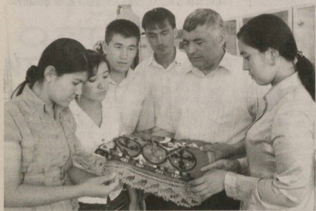
В Сурхандарьинской области, как и по всей стране, осуществляется масштабная работа по созданию всех необходимых условий для духовного и нравственного воспитания молодежи, раскрытия интеллектуального потенциала юношей и девушек.

Большие преобразования коснулись и главного научного центра региона — Термезского государственного университета, на десяти факультетах которого обучается свыше семи тысяч человек.