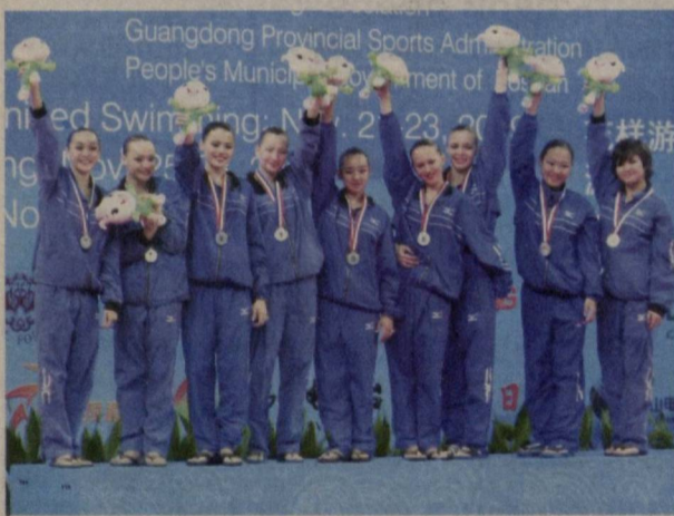
Наряду с другими видами спорта в Узбекистане весьма успешно развивается синхронное плавание.