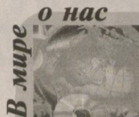
В мире о нас

Популярный ежемесячный индийский журнал «Business Central Asia», регулярно освещающий политико-экономическую и культурную жизнь стран Центральной Азии, особое внимание уделяет Узбекистану.