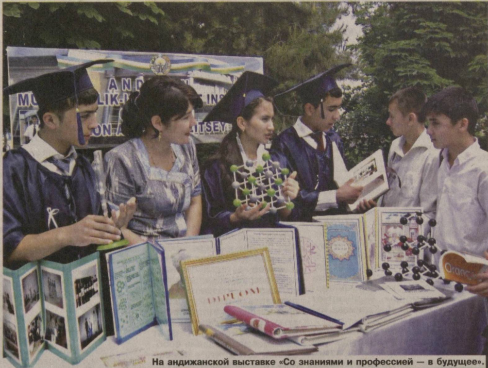
На андижанской выставке «Со знаниями и профессией — в будущее».