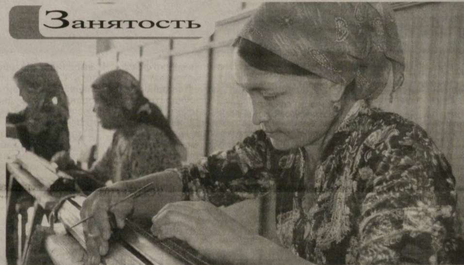
Благодаря занятию ремесленничеством многие семьи схода граждан «Каракурган» Мархаматского района Анджанской области обеспечены постоянным источником дохода.

Среди сельских женщин широко распространено вязание платков. Необходимо для производства сырья сюда завозится с