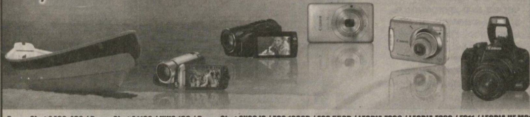
PowerShot A480-490 / PowerShot A1100 / IXUS 130 / PowerShot SX20 IS / EOS 1000D / EOS 550D / LEGRIA FS36 / LEGRIA FS20 / FST1 / LEGRIA HF M31