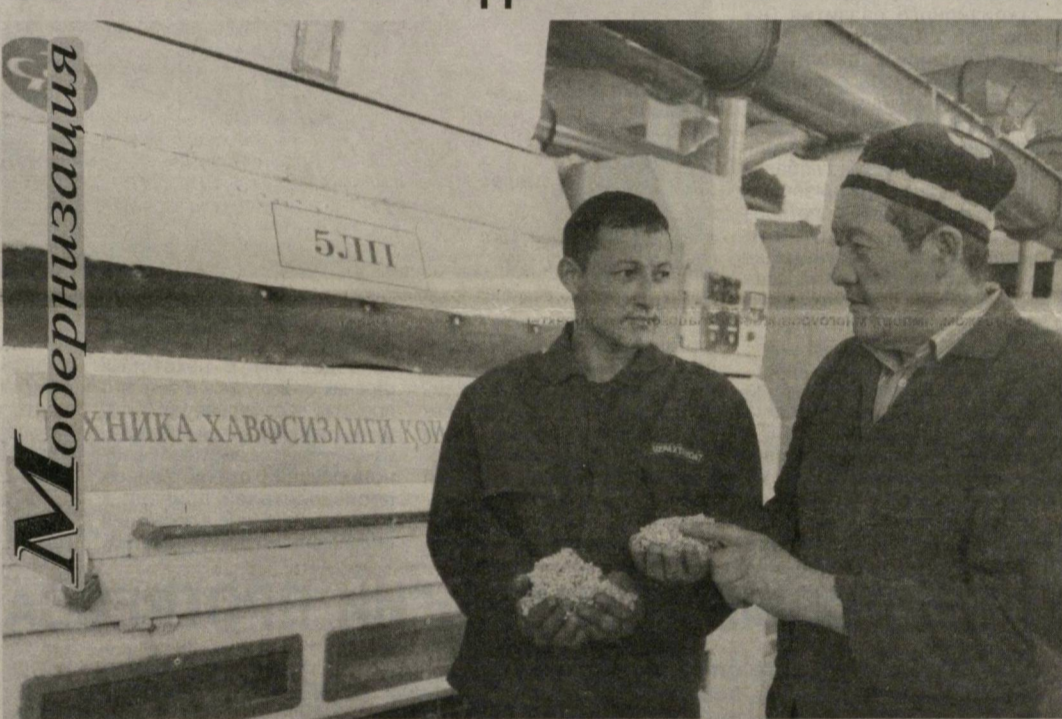
На Ангорском хлопкоочистительном заводе в Сурхандарьинской области полностью завершена модернизация и техническое перевооружение производственных участков.

На эти цели здесь было израсходовано свыше 4,3 миллиарда сумов. Однако уже первые месяцы работы после реконструкции подтвердили целесообразность столь солидных капиталовложений. — Современное оборудование дает возможность экономить