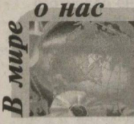
В мире о нас

Ежедневная общественно-политическая газета Латвии «Вести сегодня» опубликовала статью, посвященную успешному развитию Узбекистана в условиях мирового финансово-экономического кризиса. Приводим этот материал с некоторыми сокращениями.