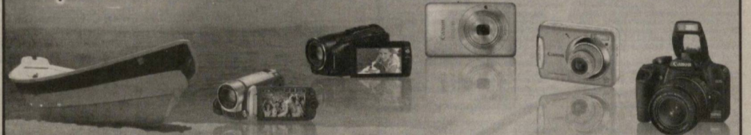
PowerShot A480-490 / PowerShot A1100 / iXUS 130 / PowerShot SX20 IS / EOS 1000D / EOS 550D / LEGRIA FS36 / LEGRIA FS20 / FS11 / LEGRIA HF M31