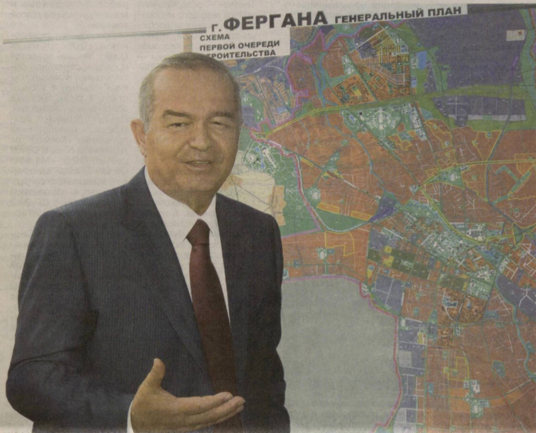
Г. ФЕРГАНА ГЕНЕРАЛЬНЫЙ ПЛАН СХЕМА ПЕРВОЙ ОЧЕРЕДИ СТРОИТЕЛЬСТВА

Президент Республики Узбекистан Ислам Каримов с целью ознакомления с ходом социально-экономических реформ, осуществляемой созидательной и благоустроительной работой на местах 27 мая посетил Ферганскую область.