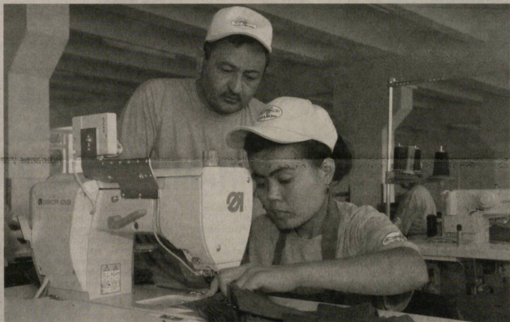
В Фергане начало действовать общество с ограниченной ответственностью «SABO royafzal».

Антикризисная программа мер — в действии