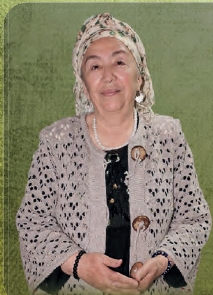
Мунаввара АБДУЛЛАЕВА, Ўзбекистон халқ артисти:

- Буниси менга қоронғи. Буни мухлислар айтиши мумкин. Сиз каби журналистлар айтиши мумкин.