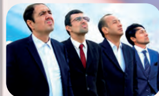
“ОСМОНДАГИ БОЛАЛАР 3” ЙИГИРМА ЙИЛЛИК СОҒИНЧИ!