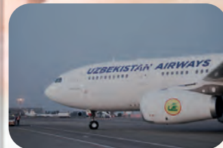
ПАРВОЗИНГИЗ БЕХАТАР БЎЛСИН!