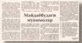
Майдабудага муаммолар фойдаланишга топширилди. 16- ва 58-сонли мактаб биноларидаги капитал таъмирлаш ишлари яқунланмоқда.

«Обод қишлоқ» дастурига асосан компания буюртмачилигида Косон туманидаги «Майдабу» МФИда 2 та умумтаълим мактаби, тиббиёт иншооти ҳамда маҳалла фуқаролар йиғини биносидан қурилиш-таъмирлаш ишлари бажарилмоқда. Айни пайтда тиббиёт иншооти (фавқуллода тиббий ёрдам станцияси)