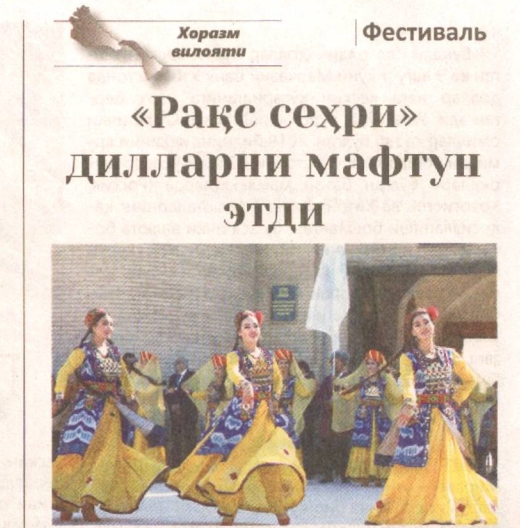
Кўҳна ва ҳамиша навқирон Хивада «Рақс сеҳри» халқор рақс фестивали ўтказилди.

Ўрикисойга туташ жилғада қад ростлаган янги мухташам сийҳаттоғ халқимиз асрларга татигулик, асарларда тараннум этса арзигулик бундай бунёдкорлик ишларига қодирлиги ва шунга яраша эъзозга муносиблигидан далолатдир.