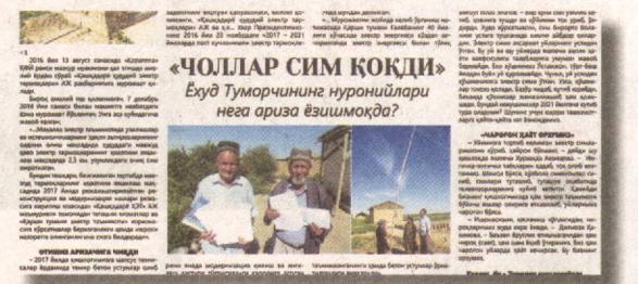
«Чоллар сим қоқди» Ўхўд Туморчининг нурунчилари нега арза ёзишмоқда?