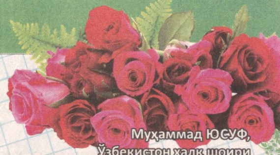
Муҳаммад ЮСУФ, Ўзбекистон халқ шоири