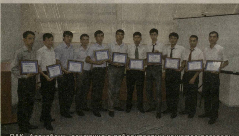
ОАК «Алокабанк» заключил с победителями конкурса договоры о предоставлении гранта и вручил сертификаты.