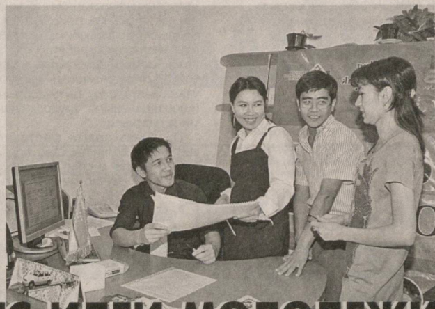
Организаторы конкурса для почти 4 000 победителей первого тура организовали обучение по основам ведения предпринимательской деятельности. Во всех регионах лучшие тренеры проводили для них бизнес-тренинги, помогали написать бизнес-план, отвечали на интересующие молодых людей вопросы.

По словам организаторов, первый тур вызвал желание проверить свои способности у огромного числа юношей и девушек. Участниками стали более 22 тысяч молодых людей. — Из 142 колледжей и 14